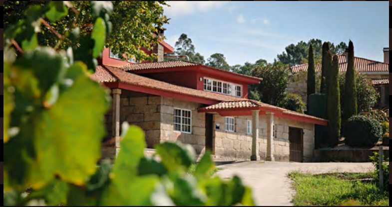
Adega Morgadío en el corazón de la D.O. Rías Baixas

La edad media del viñedo en Morgadío es de 40 años