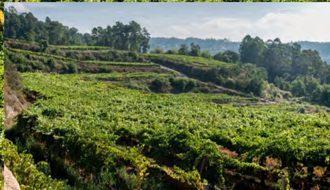
Finca Morgadio. Albeos, Creciente, Pontevedra.