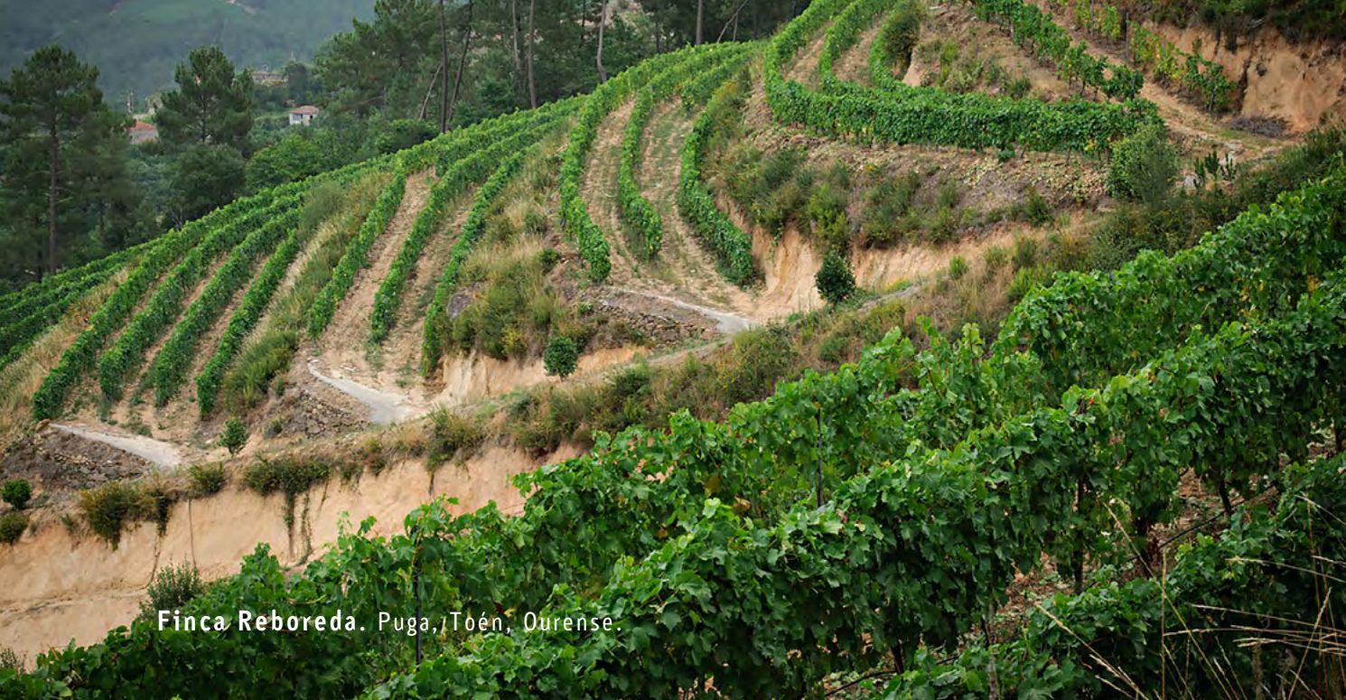
Finca Reboreda. Puga, Toén, Ourense.