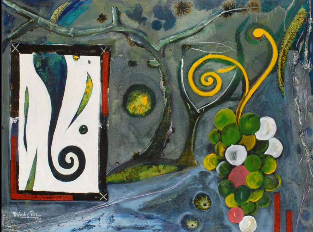
Ramón Méndez Paz «El tiempo atrapado en un instante» Óleo conmemorativo del 75 aniversario de GRM. 2015