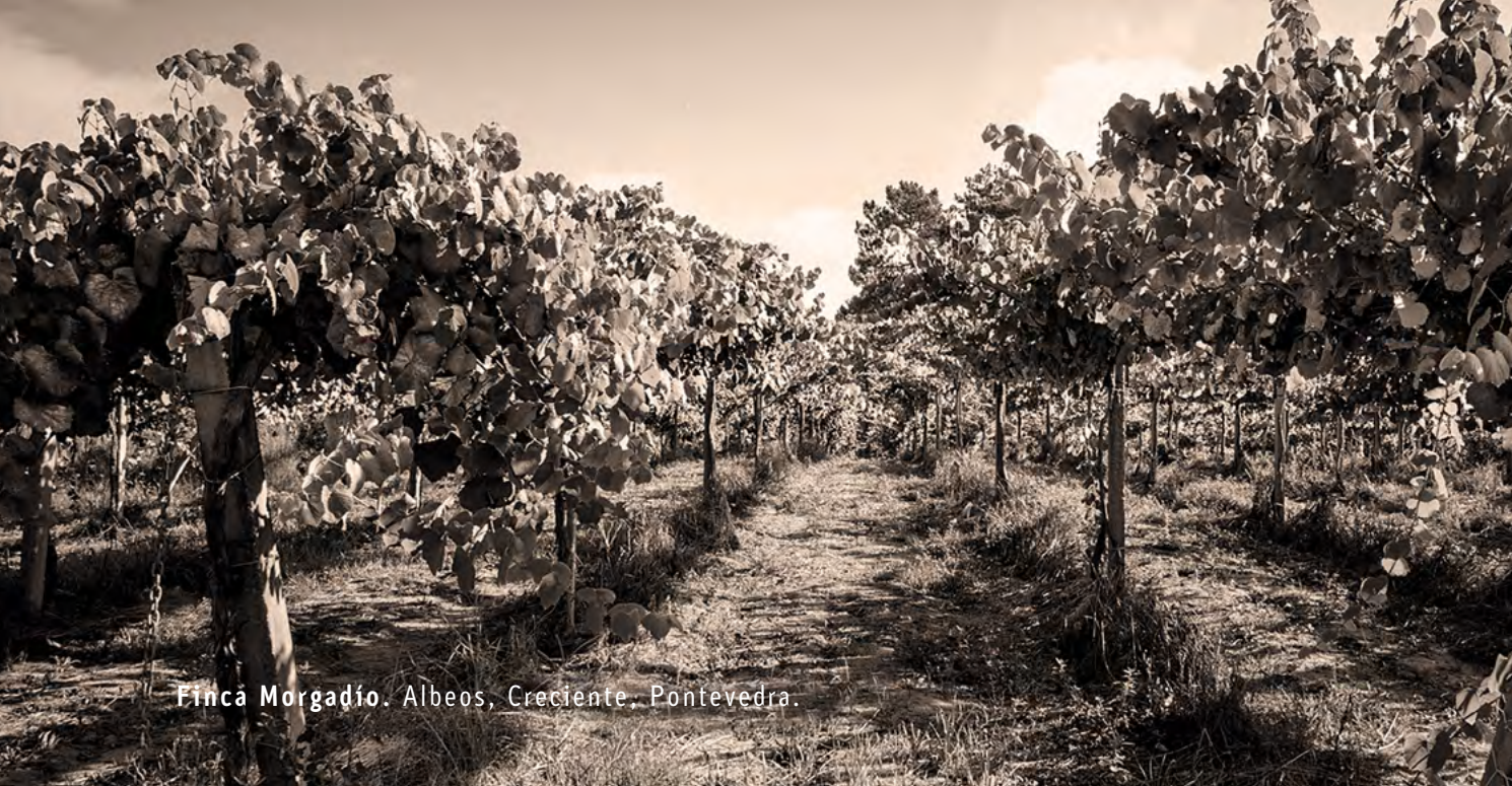
Finca Morgadio. Albeos, Creciente, Pontevedra.